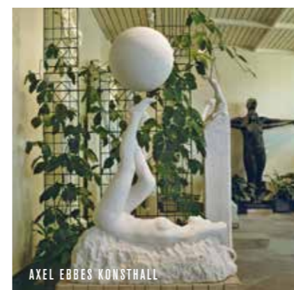
AXEL EBBES KONSTHALL

Trelleborg och Söderslätt är en del av det maktcentrum kring Öresund som uppstod för drygt 1000 år sedan. Området var välbefolkat, och här sträcker sig blomstrande handel, sjöfart, tro och folkliv in i våra dagar.